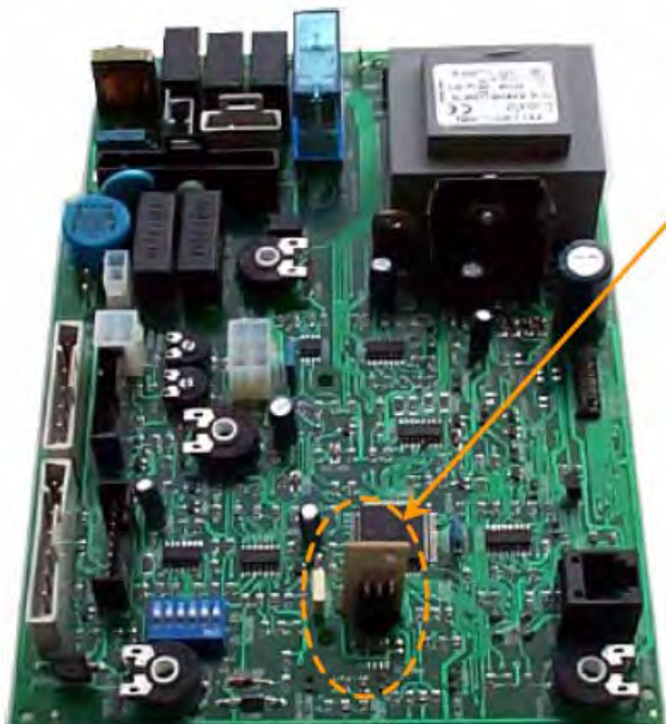
Рис. 1: Плата + ПЗУ

Выбор нужной модели осуществляется установкой в одну и ту же плату разных ПЗУ. Все варианты ПЗУ приведены в информационном отчете внизу.