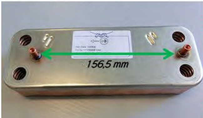
Old Plate to Plate Exchanger