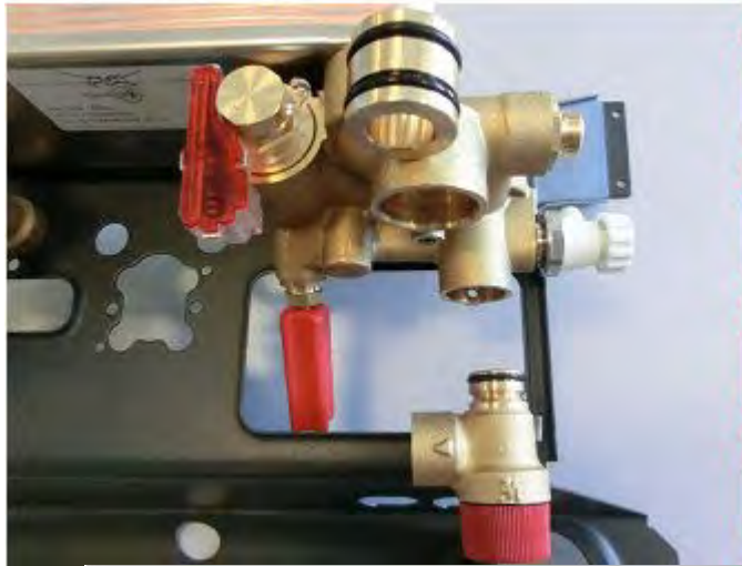
Old Inlet Group